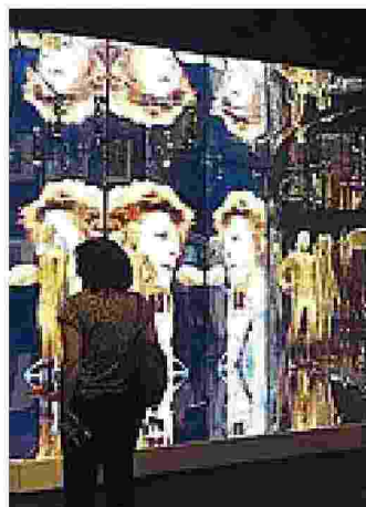
Allestimento La mostra

Il «break even» dell'esposizione si trova a quota 100 mila visitatori Bowie prima di essere un cantante è un artista a tutti gli effetti, per questo motivo la mostra la si fa qui al Mambo